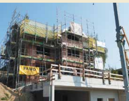
Trottenweg