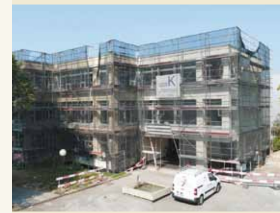
Teilsanierung Schulhaus Rain I