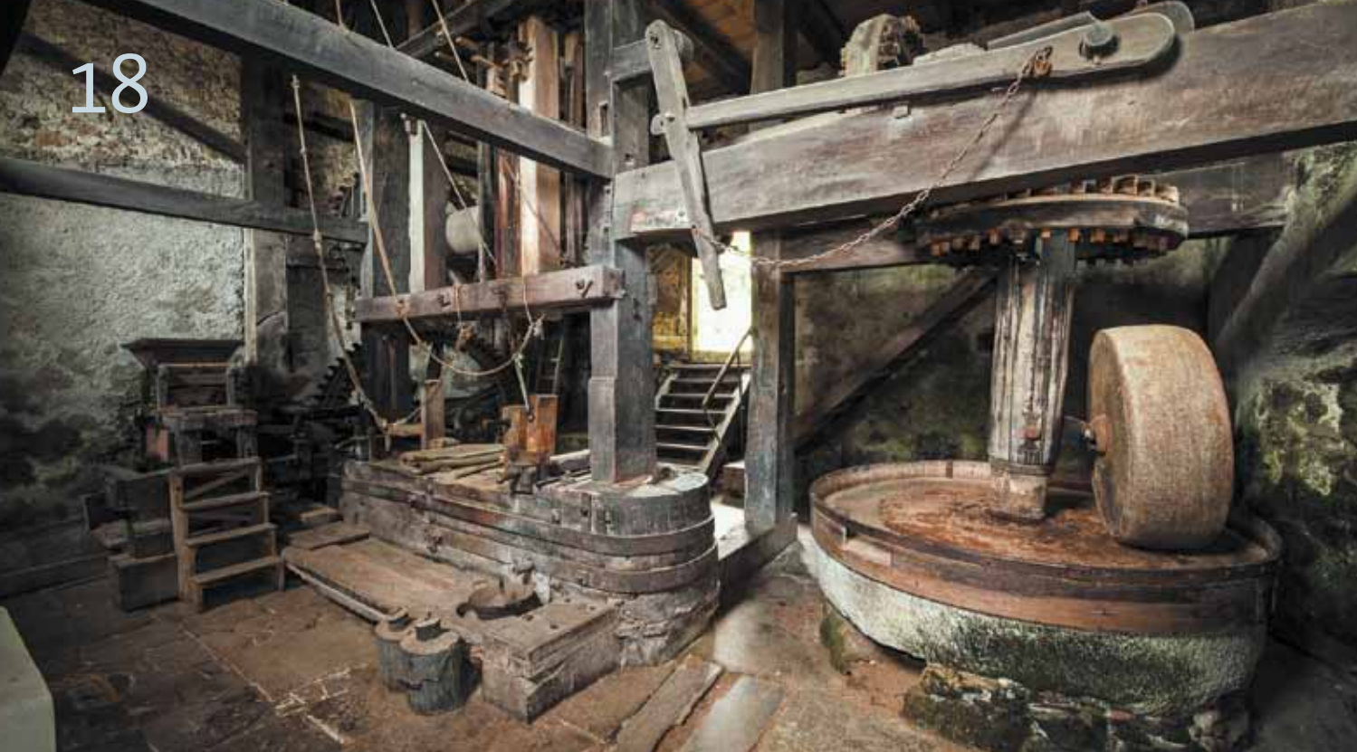
Ölmühle Böttstein