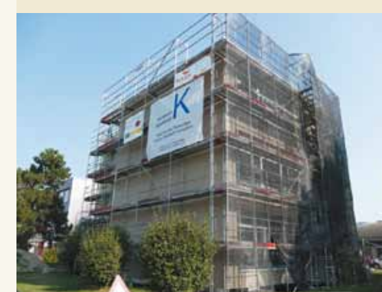
Teilsanierung Schulhaus Rain I