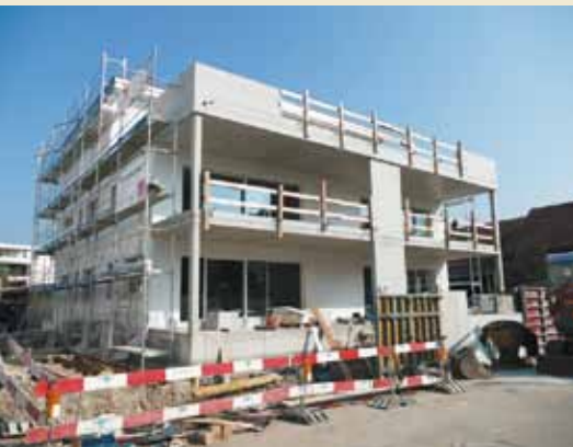
Margrethenweg