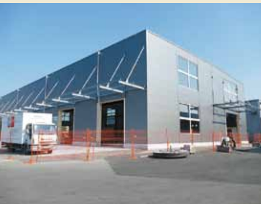
Industriestrasse