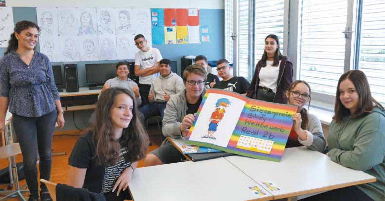
Preisüberreichung Bördy - Wettbewerb